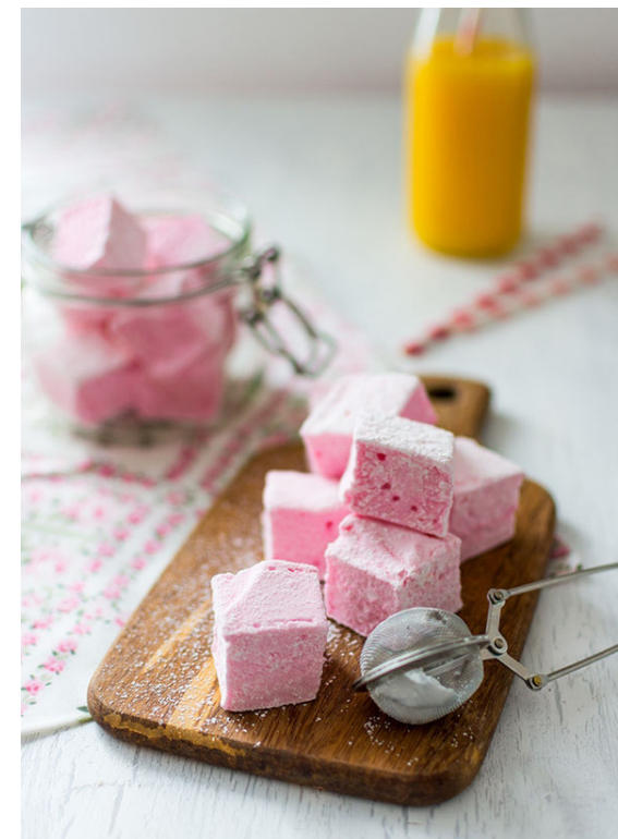
Guimauves - Février 2017